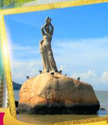
จูไห่พีซเซอร์เกิร์ล