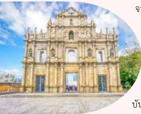
แห่งเดียวเท่านั้นในโลก

หมายเหตุ: เนื่องจาก เจ้าแม่กวนอิมริมทะเล อยู่ระหว่างการซ่อมบำรุง ตั้งแต่ตอนนี้จนถึงเดือน เมษายน 2567 กรุณ ัณ วันที่เดินทางยังซ่อมบำรุงไม่เรียบร้อย ทางบริษัทของสงวนสิทธิ์ ในการนำท่านเดินทางสู่ ไทปาสตริทฟูด ถนนที่เต็มไปด้วยร้านอาหาร ขนม ของอร่อยเมืองมาเก๊า ทดแทน