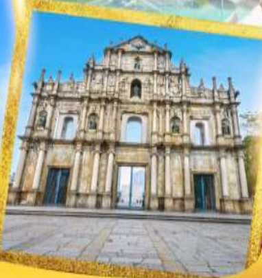
วิหารเซนต์ปอลเซนต์ปอล