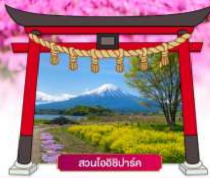
สวนโออิชิปาร์ค