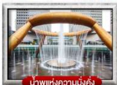
น้ำพุแห่งความมั่งคั่ง