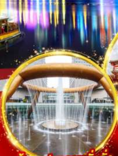
น้ำพุแห่งความมั่งคั่ง