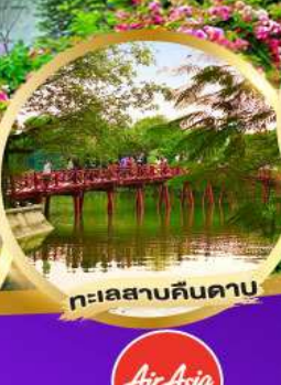
ทะเลสาบคินตาดาน