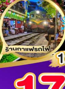
ร้านกาแฟพรตโพ