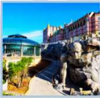
หมู่บ้านฝรั่งเศส

นำท่านนั่งกระเช้ายาวที่สุดในโลก ได้รับการบันทึกสถิติโลกโดย เกิลด์เรคคอร์ด WORLD RECORD ประเภท NON STOP กระเช้านี้มี ความยาวถึง 5,042 เมตร