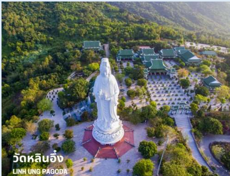
วัดหลินอึ้ง LINH UNG PAGODA

ขอสงวนสิทธิ์ในการเลือกที่นั่งบนเครื่องบิน เนื่องจากเป็นตั๋วกรุ๊ป การจัดที่นั่งจะเป็นระบบ RANDOM ที่นั่งอาจจะไม่ได้นั่งติดกัน ทางบริษัทไม่สามารถเข้าไปแทรกแซงได้ ซึ่งเป็นไปตามเงื่อนไขของสายการบินเป็นผู้กำหนด