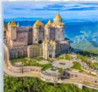
ปราสาทจันทรา