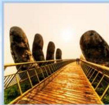
สะพานทอง