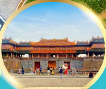
พระราชวังโบราณไคโนย

เมนูพิเศษ! กุ้งมังกรซอสเนย + หม้อไฟ ทะเล SEAFOOD 1 มื้อ, ปิ้งย่าง ซาซุ 1 มื้อ