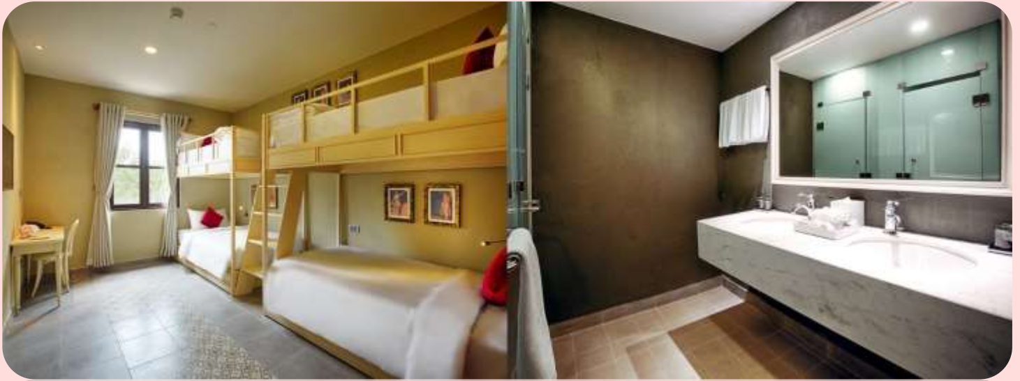
ห้องแบบ Standard Rooms