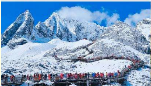
ภูเขาคิมะมังกรหยก