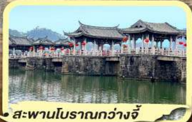
• สะพานโบราณกว้างจี