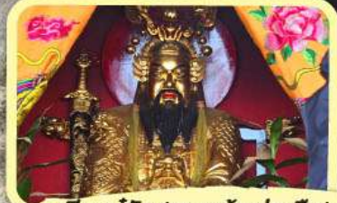
• เอียงบู๊ชิว (ศาลเจ้าพ่อเสือ)