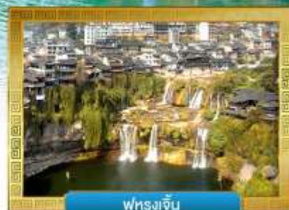
ฟูรงเจิน