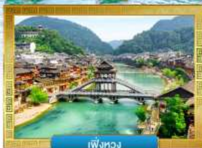
เฟิ่งหวง