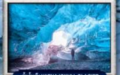
ถ้ำน้ำแข็ง VATNAJOKULL GLACIER

บินทรู สายการบิน Full Service | พิเศษ! ทานอาหารโดนกระจกิว 360 องศา