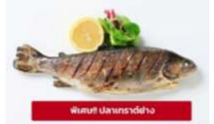
ปลาเทราต์ย่าง

เที่ยง ๑๐ รับประทานอาหารเที่ยง (มื้อที่6) เมนูพิเศษ ปลาเทราต์ย่างท่านละ 1 ตัว นำท่านเดินทางสู่ เมืองมรดกโลกเชสกี ครุมลอฟ (Cesky Krumlov) สาธารณรัฐเช็ก (ระยะทาง 210 กม./ 3.30 ชม.) ล้อมรอบด้วยแม่น้ำ Vltava ทำให้เมืองแห่งนี้มีลักษณะคล้ายหยดน้ำ จนถูกขนานนามว่าเป็น "เมืองหยดน้ำ" จากนั้นนำท่านถ่ายรูปบริเวณรอบนอก ปราสาทครุมลอฟ (Cesky Krumlov Castle) เป็นปราสาทกอธิคดั้งเดิม ตั้งอยู่ริมฝั่งแม่น้ำวัลตาวาบนแหลมหิน มีหอคอยสี่มุมพวยหวนๆ ราวกับปราสาทเจ้าหญิงในนิยาย มีอายุกว่า 700 ปี เคยเป็นคฤหาสน์ส่วนตัวของขุนนางถึง 3 ตระกูล ก่อนจะตกเป็นสมบัติของรัฐบาล