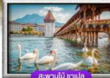
สะพานไม้ ชาเปล