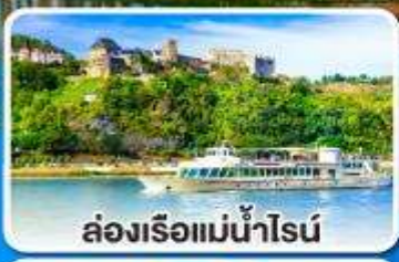
ล่องเรือแม่น้ำไรน์