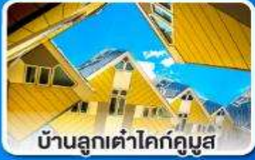
บ้านลูกเต่าโคกคูมูส