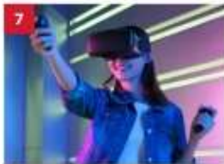
ESC Experience Lab Experience the latest in virtual and augmented reality technology for non-stop thrills.