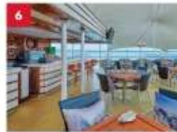
Seafood Grill Enjoy your favourite outdoor hot pot dining with a wide selection of meats, seafood or vegetarian options, paired with an extensive beverage list.