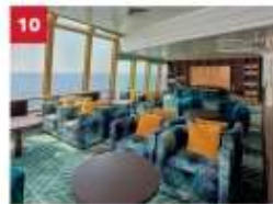
Palm Court Relax in our sophisticated observatory lounge as you enjoy sweeping ocean views.