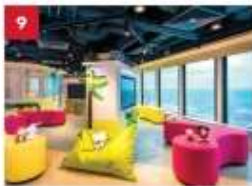
Little Dreamers Club Feed your children's imaginations with games, workshops, costume parties and even a DJ booth at our kids-only club.