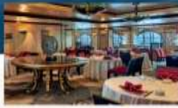
Silk Road Traditional Dim Sum and Cantonese cuisine