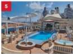
Parthenon Pool Go for a dip in our outdoor Roman-themed pool deck with Caesar's Slide, hot tubs, a stage for live bands and a mega LED screen.