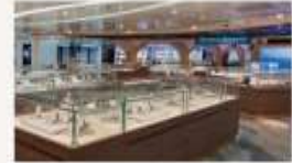
The Boutiques International duty-free shopping