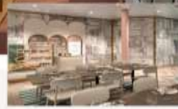
The Little Cake Café Decadent cakes and artisanal chocolates