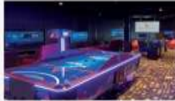
The Zone Multipurpose lounge featuring game consoles