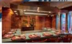
Umi Uma Sushi & Teppanyaki Signature Japanese dishes