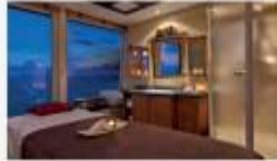
Spa Private treatment rooms, reflexology lounge and saunas