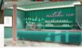
Matcha Ice Popular Matcha ice cream and Taiwan milk tea