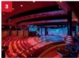
Zodiac Theatre Catch a signature production live show in our opulent theatre.