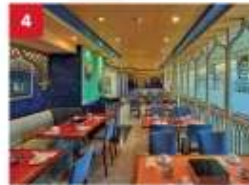
Hot Pot Enjoy your favourite noodles with an extensive list of beverages available to complement your dinner.