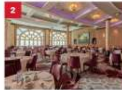
Dream Dining Room Savour Chinese and Western cuisine in our elegant main inclusive dining room.