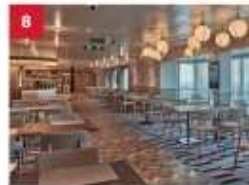
Mozzarella Ristorante & Pizzeria For adventurous foodies, savour a modern fusion of classic Italian dishes and pizzas with a Japanese twist.