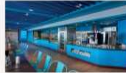
Blue Lagoon Delicious hawker food with Asian and International classics