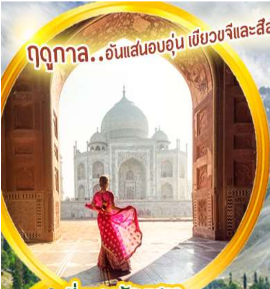
เที่ยวชมทัชมาฮาล

ฤดูกาล...อันแสนอบอุ่น เขียวขจีและสีส้มของดอกไม้ป่า