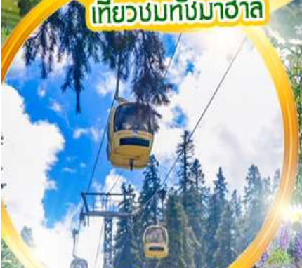
กระเช้า gondol 360 องศา