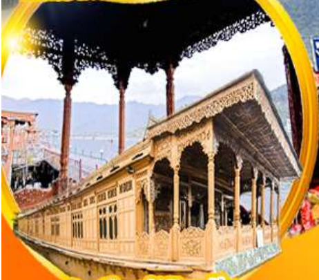
บ้านเรือสมัยวิทอเรีย