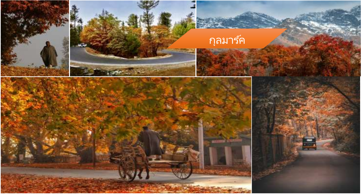
กุลมาร์ค

บริการอาหารเช้า ณ โรงแรม นำท่านเดินทางสู่ กุลมาร์ค (Gulmarg) ใช้เวลาเดินทางประมาณ 3-4 ชั่วโมง ภูเขาหิมะที่ "กุลมาร์ค" (Gulmarg) หรือเดิมเรียกเการิมาร์ค ภูเขาที่สวยงามที่สุดของแคชเมียร์ เดิมเรียกเการิมาร์ค ตั้งโดยสลต่าน ยูซุปซาร์ในศตวรรษที่ 16 เนื่องจากที่นี่เป็นทุ่งหญ้าที่เต็มไปด้วยดอกไม้ป่าตามฤดูกาลและในปัจจุบันยังเป็นสถานที่ตั้งของสนามกอล์ฟ 18 หลุมที่สูงที่สุดในโลก (3,000 เมตรจากระดับน้ำทะเล) ที่สำคัญยังเป็นสถานที่เล่นสกีที่ขึ้นชื่อว่าถูกที่สุดในโลก อีกทั้งทัศนียภาพยังงดงามไม่แพ้แถบยุโรปเลย กุลมาร์คสถานที่ท่องเที่ยวสุดฮิตในแคชเมียร์ ที่ได้รับความนิยมจากนักท่องเที่ยวทั่วโลกเป็นภูเขาที่สวยงามที่สุดแห่งหนึ่งใน แคชเมียร์