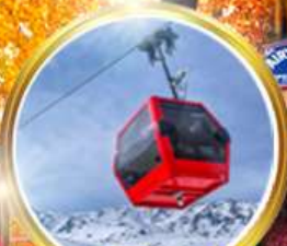
กระเช้ากุลมาร์ค ชมวิวสุดอลังการ