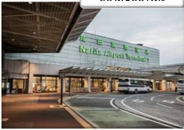
สนามบินนาริตะ

เจ้าหน้าที่รอรับลูกค้าทุกท่านที่สนามบินนาริตะ