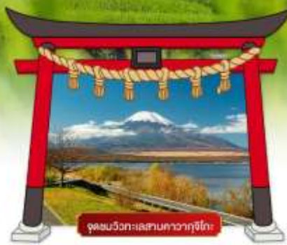
จุดชมวิวกะหลาบคาวากูจิโกะ