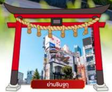
ย่านชินจูกุ

เดินทางโดยสายการบิน : ไทยแอร์เอเชียเอ็กซ์