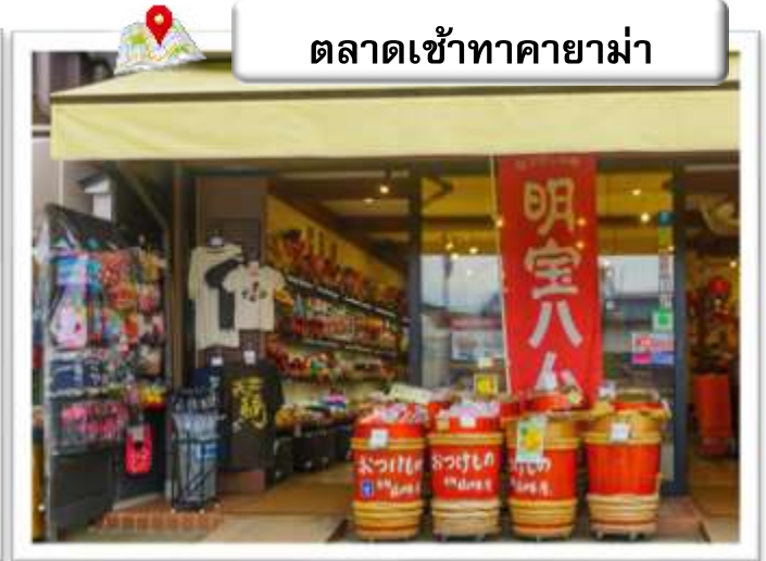
ตลาดเช้าทาคาม่า

ตลาดเช้าทาคาม่า (TAKAYAMA MORNING MARKET) ตั้งอยู่ในเมืองทาคาม่า จังหวัดกิฟุเป็นตลาดเก่าแก่ ซึ่งเริ่มมาตั้งแต่สมัยเอโดะ หรือเมื่อประมาณ 200 ปีก่อน โดยเป็นที่สำหรับขายผักผลไม้ รวมถึงอาหารต่าง ๆ ในปัจจุบันนั้นมีสินค้าขายหลากหลายทั้งอาหารสด และอาหารพร้อมทาน และยังมีพวกของที่ระลึกซึ่งเป็นของ พื้นเมืองจำหน่ายอีกด้วย