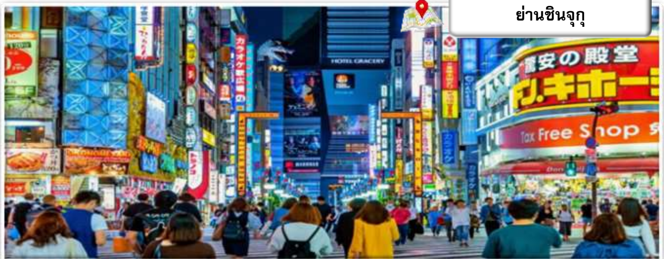
ย่านชินจูกุ

นำท่านช้อปปิ้ง ย่านชินจูกุ (Shinjuku) ซึ่งโดดเด่นด้วยอาคารที่ว่าการมหานครโตเกียว (The Tokyo Metropolitan Government) ตั้งตระหง่านอยู่นั้น คือย่านธุรกิจที่เฟื่องฟูที่สุดในโตเกียว (Tokyo) นอกจากจะเต็มไปด้วยห้างสินค้าแฟชั่นและห้างสรรพสินค้าขนาดใหญ่อย่าง Isetan, Takashimaya และ Marui เรียงรายกันอยู่มากมายแล้ว บริเวณทางออกฝั่งตะวันออกของสถานีชินจูกุยังมีห้างร้านให้นักท่องเที่ยวหลากหลายกลุ่มวัยได้ช้อปปิ้งกันอย่างจุใจอีกมากมาย ไม่ว่าจะเป็นดีสคาร์ทสไตล์อย่าง Don Quijote ร้านขายเครื่องใช้ไฟฟ้าอย่าง Yamada Denki หรือจะเป็น Shinjuku Subnade ซึ่งมีร้านสินค้าหลากหลายแบรนด์รวมถึงร้านร้อยเยนอยู่ภายใน