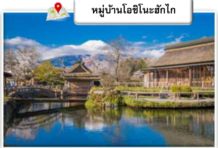
หมู่บ้านโอชิโนะฮักไก

หมู่บ้านโอชิโนะ ฮักไก (Oshino Hakkai Village) เป็นหมู่บ้านที่ตั้งอยู่ใกล้ภูเขาไฟฟูจิ บริเวณทะเลสาบยามานาคาโกะ (Lake Yamanaka-ko) ซึ่งในปี 2013 ฟูจิซังได้รับเลือกให้เป็นมรดกทางวัฒนธรรมของโลก ที่นี่เองก็ได้รับเลือกในฐานะส่วนหนึ่งของฟูจิซังด้วย และเพราะในบริเวณนี้มีบ่อน้ำใส ๆ รวมกันกว่า 8 บ่อ ทำให้คนไทยเราเรียกที่นี่ว่า "หมู่บ้านน้ำใส" นั่นเอง