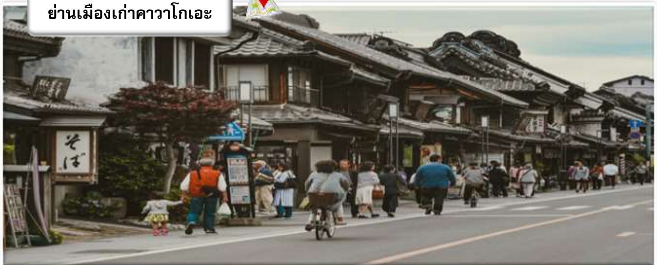
ย่านเมืองเก่าคาวาโกเอะ