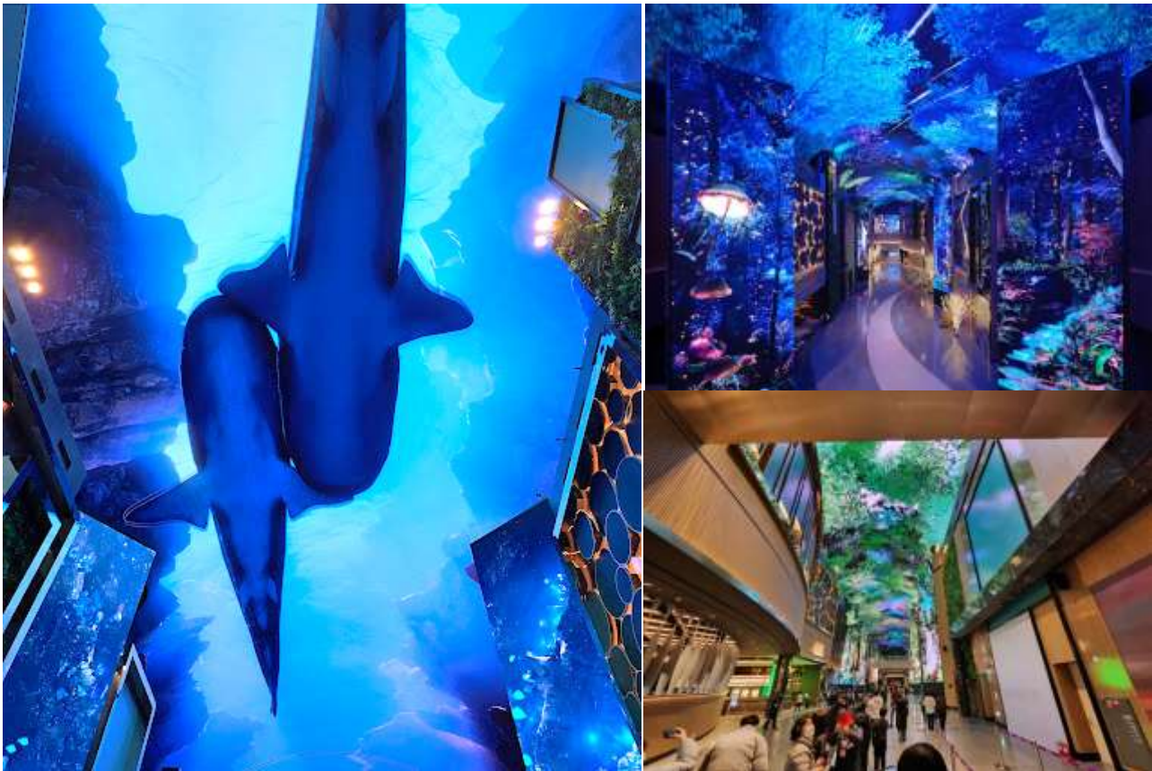
อาหารกลางวัน (1)

นี่คือจุดหมายปลายทางใหม่ล่าสุด INSPIRE Entertainment Resort เปิดให้บริการในปี 2567 เป็นรีสอร์ท Mohegan ล่าสุด และใหญ่ที่สุดในเอเชียเหนือ รีสอร์ทเพื่อความบันเทิงครบวงจรแห่งนี้ประกอบด้วยโรงแรมระดับ 5 ดาว คาสิโน ห้างสรรพสินค้า ร้านอาหารที่มีเอกลักษณ์เฉพาะตัว ห้องนิทรรศการ สถานที่แสดงไนรม์ INSPIRE Arena สวนน้ำ และสิ่งอำนวยความสะดวกด้านความบันเทิงอื่นๆ รีสอร์ทแห่งนี้มีรูปลักษณ์ร่วมสมัย โดยมี AURORA ซึ่งเป็นถนน LED ยาว 150 เมตรที่จัดแสดงการผสมผสานระหว่างเทคโนโลยี และศิลปะดิจิทัลทุกๆ 30 นาที คุณจะรู้สึกราวกับว่ากำลังเดินลอดเคี้ยวท่ามกลางหย้าสูงในป่าลึกลับ อยู่ใต้ท้องฟ้าสีครามที่ไร้ขอบเขต หรือบางทีคุณอาจพบว่าตัวเองจมอยู่ใต้น้ำลึกของมหาสมุทรสีฟ้า ท่องไปในความอัศจรรย์ในพื้นที่ดิจิทัลอันกว้างใหญ่ที่ไม่เคยมีมาก่อน