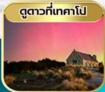
ดูตาวที่เทคาโป

จัดเต็ม!! รวมทิปคนขับรถ + ทิปหัวหน้าทัวร์ ราคาธรรมิชา / รวมทุกอย่างแล้ว