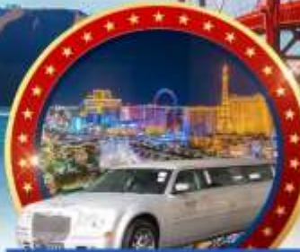
นั่ง Limousine ชมเมือง Las Vegas