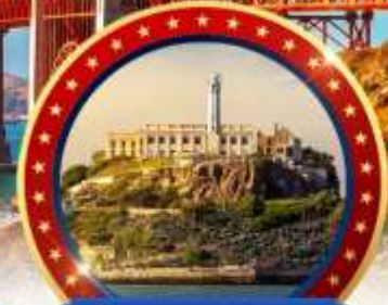
เข้าชมเกาะ Alcatraz