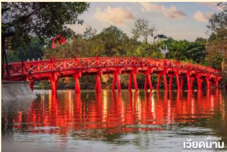
เวียดนาม

นำท่าน ชมทะเลสาบคินดาบ ทะเลสาบใจกลางเมืองฮานอย ทะเลสาบแห่งนี้มีตำนานกล่าวว่า ในสมัยที่เวียดนามทำสงครามสู้รบกับประเทศจีน กษัตริย์แห่งเวียดนามได้ทำสงครามมาเป็นเวลานาน แต่ยังไม่สามารถเอาชนะทหารจากจีนได้สักที ทำให้เกิดความท้อแท้พระทัย เมื่อได้มาล่องเรือที่ทะเลสาบแห่งนี้ได้มีเต่าขนาดใหญ่ตัวหนึ่งได้คาบดาบวิเศษมาให้พระองค์เพื่อทำสงครามกับประเทศจีน หลังจากที่พระองค์