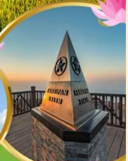
ฟานชิปัน