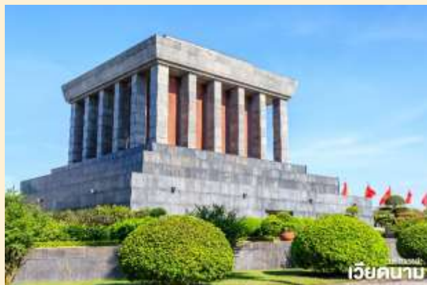
เวียดนาม

นำท่าน ชม จัตุรัสบาติญ เป็นจัตุรัสที่มีชื่อเสียงของกรุงฮานอย ซึ่งมีความสำคัญทางประวัติศาสตร์คือประธานาธิบดีคนแรกของเวียดนามได้มาอ่านคำประกาศอิสรภาพ ณ ที่แห่งนี้ เมื่อวันที่ 2 กันยายน 1945 หลังสงครามโลกครั้งที่สอง และเป็นที่ตั้งของทำเนียบและกระทรวงต่างๆ รวมถึงอนุสรณ์สถานโฮจิมินห์อีกด้วย นำท่านชม โบสถ์ฮานอย เป็นสถานที่สำคัญอีกแห่งหนึ่งของเวียดนาม