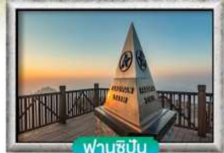
ฟานชีปัน