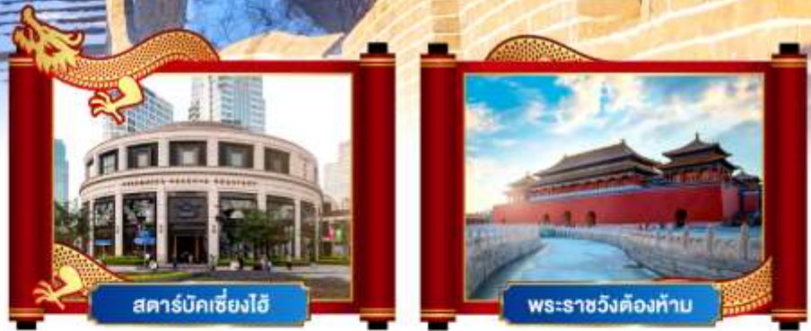
สตรีมมิ่งปักกิ่งไฮ้