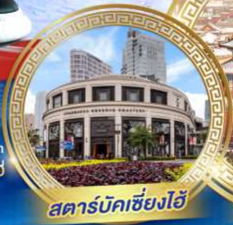
สตาร์บัคเซี่ยงไฮ้