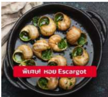
พิเศษ หอย Escargot

เย็น ๑๑ รับประทานอาหารเย็น (มือที่16) เมนูพิเศษ!! หอยเอสคาโก้ (Escargot)