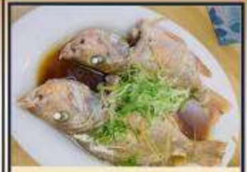
ปลาหนึ่งซีอิ้ว