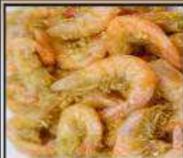
กุ้งทอดกระเทียม