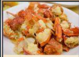
กุ้งมังกรอบซีส