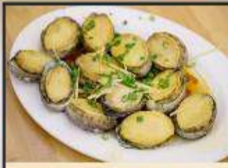
เป่าฮื้อสดหนึ่ง