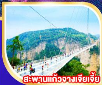
สะพานแก้วฉางเจียเจีย