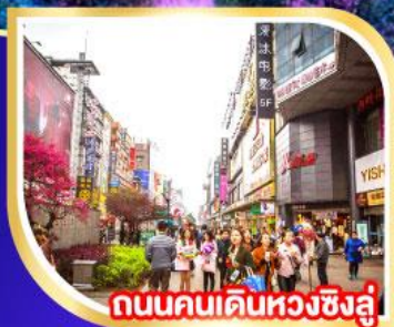
ถนนคนเดินหวงชิ่งลู่