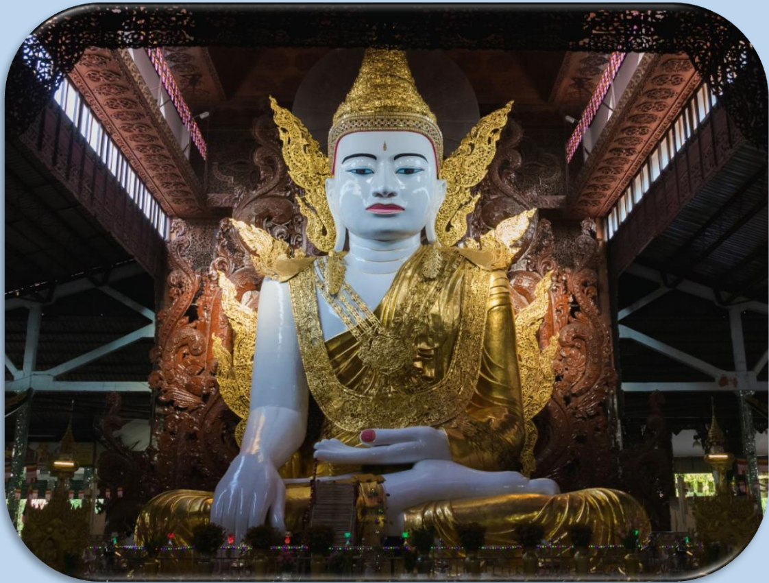
สมควรแก่ เวลานำท่าน

เดินทางสู่ สนามบินย่างกุ้ง เพื่อเดินทางกลับสู่ประเทศไทย