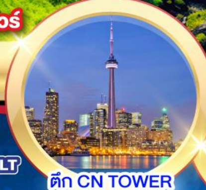
ตึก CN TOWER

พักโรงแรมย่านโทมัสแควร์ เดินทาง 08-18 เม.ย. 68