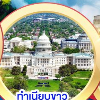
ทำเนียบขาว วอชิงตันดีซี