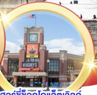
ฮอर्सช็อคโกแลตเวิลด์