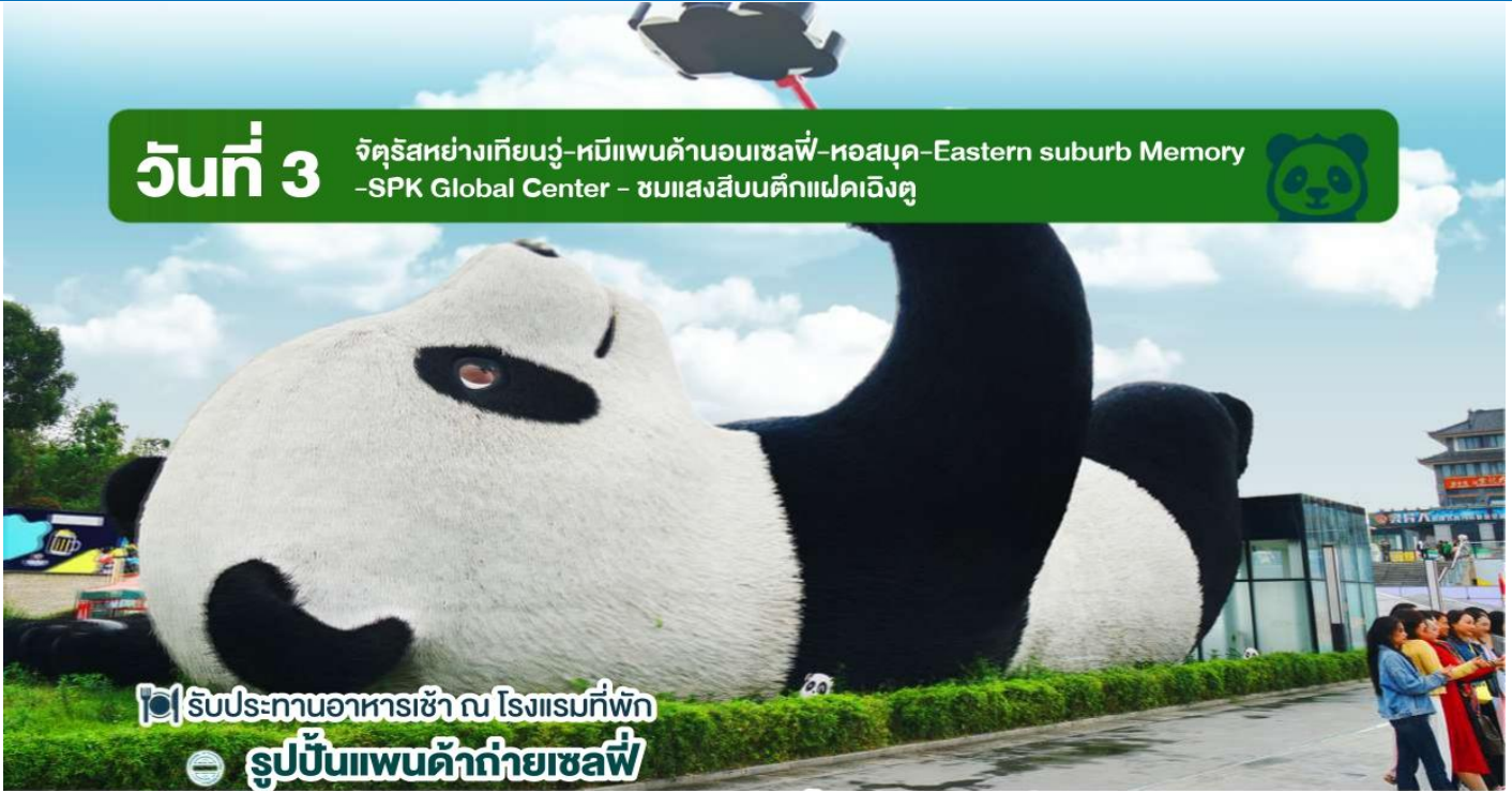
📷 รับประทานอาหารเช้า ณ โรงแรมที่พัก 📍 รูปปั้นแพนด้ายักษ์เซลฟี

นำท่านสู่จัตุรัสหยางเทียนวู้ (Yangtianwo Square) ตั้งอยู่ที่เมืองตูเจียงเยี่ยน มณฑลเสฉวน ประเทศจีน เป็นสถานที่พักผ่อนหย่อนใจที่มีภูมิทัศน์สวยงาม โดยมีไฮไลท์คือ รูปปั้นแพนด้ายักษ์กำลังเซลฟี ที่ตั้งอยู่กลางจัตุรัสสุดน่ารัก ซึ่งออกแบบโดยนักออกแบบชื่อดัง FLORENTIJN HOFMAN ซึ่งดึงดูดนักท่องเที่ยวให้มาถ่ายรูปและเช็คอิน นอกจากนี้ จัตุรัวยังมีพื้นที่สีเขียว เส้นทางสำหรับเดินปั่นจักรยาน น้ำพุขนาดใหญ่ที่เปิดแสดงในเวลาากลางคืนและเป็นสถานที่จัดกิจกรรมวัฒนธรรมต่างๆ อีกด้วย