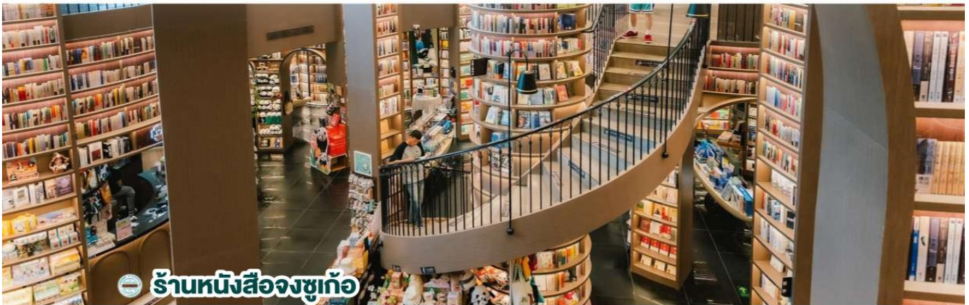
📍 ร้านหนังสือจิงซูเก้อ

นำท่านสู่จัตุรัสหยางเทียนวู้ (Yangtianwo Square) ตั้งอยู่ที่เมืองตูเจียงเยี่ยน มณฑลเสฉวน ประเทศจีน เป็นสถานที่พักผ่อนหย่อนใจที่มีภูมิทัศน์สวยงาม โดยมีไฮไลท์คือ รูปปั้นแพนด้ายักษ์กำลังเซลฟี ที่ตั้งอยู่กลางจัตุรัสสุดน่ารัก ซึ่งออกแบบโดยนักออกแบบชื่อดัง FLORENTIJN HOFMAN ซึ่งดึงดูดนักท่องเที่ยวให้มาถ่ายรูปและเช็คอิน นอกจากนี้ จัตุรัวยังมีพื้นที่สีเขียว เส้นทางสำหรับเดินปั่นจักรยาน น้ำพุขนาดใหญ่ที่เปิดแสดงในเวลาากลางคืนและเป็นสถานที่จัดกิจกรรมวัฒนธรรมต่างๆ อีกด้วย