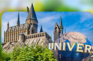
เลือกอิสระ Universal Studios Japan

HOTEL TETORA KYOTO EKIMAE หรือเทียบเท่ามาตรฐานญี่ปุ่น IZUMINO CENTER HOTEL หรือเทียบเท่ามาตรฐานญี่ปุ่น IZUMINO CENTER HOTEL หรือเทียบเท่ามาตรฐานญี่ปุ่น