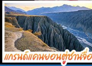
แกรนด์แคนยอนคู่ซานจื่อ