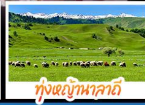
กู่หนัญนาลาถี้