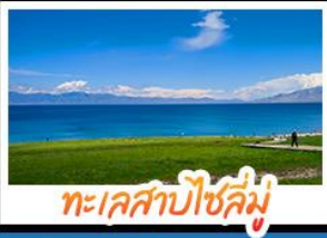
ทะเลสาบไซลีมู่

หุบเขาดอกท้อ - ทะเลสาบไซลีมู่ แกรนด์แคนยอนคู่ซานจื่อ - กู่หนัญนาลาถี้