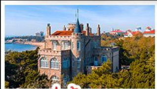
ป่าต่ากวน

พระราชวังฤดูร้อน - วิวเมืองซิงเต่า รถไฟความเร็วสูง - ภูเขาเหลาซาน กำแพงเมืองจีนด้านจวิ๊ยกกวน - ป่าต่ากวน พักโรงแรมระดับ 4 ดาว - ไม่ลงร้านช้อปปิ้ง มื้อพิเศษ เปิดปักกิ่ง , หม้อไฟซีฟู้ด