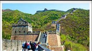
กำแพงเมืองจีนด้านจวิ๊ยกกวน