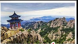
ภูเขาเหลาซาน