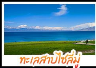
ทะเลสาบไซลีมู

หุบเขาดอกท้อ - ทะเลสาบไซลีมู แกรนด์แคนยอนตุ๋ชานจื่อ - ทุ่งหญ้านาลาดี