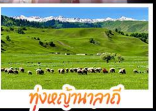
ทุ่งหญ้านาลาดี