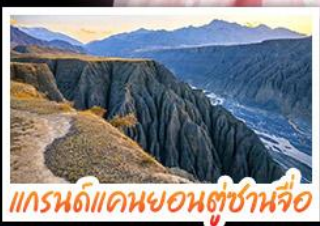
แกรนด์แคนยอนตุ๋ชานจื่อ