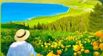
ทะเลสาบไซ่หลี่มู่