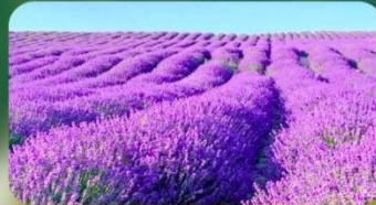
ทุ่งลาเวนเดอร์