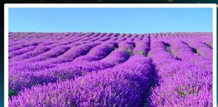
ทุ่งลาเวนเดอร์