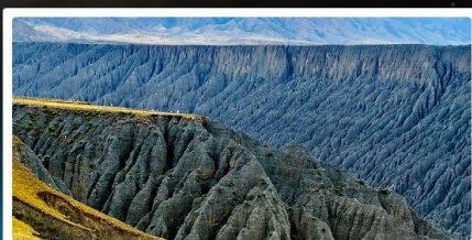
แกรนด์แคนยอนตู้ซานจื่อ