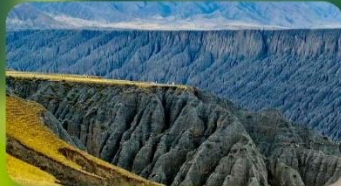
แกรนด์แคนยอนคู่ชานจื่อ