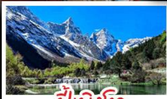
ปี่ฝงโกว