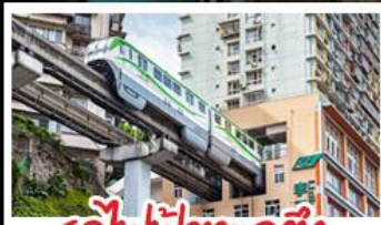
รถไฟฟ้าทะลุคติก