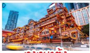
ตงเตยงตัง

อุทยานหลุมบ่อฟ้า - อุทยานเขานางฟ้า หงหยาดัง - นังรถไฟทะลุคติก - อุทยานสี่ดรุณี ปี่ฝงโกว - สะพานหนานเตียง