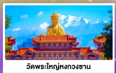
วัดพระใหญ่หงกวงซาน