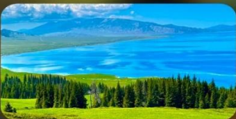
ทะเลสาบโซหลี่มู่