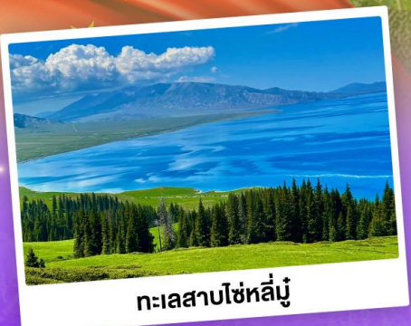
ทะเลสาบไซหล่มู่

เที่ยวทุ่งหญ้าคอกองฟ้า นาราตี ชมความสวยงามทะเลสาบไซหล่มู่