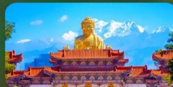
วัดพระใหญ่หรงกงซาน