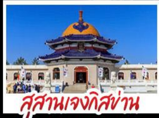
สุสานเจกิสข่าน