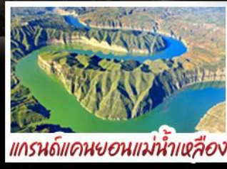
แกรนด์แคนยอนแม่น้ำเหลือง