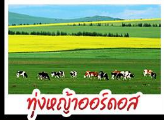
ทุ่งหญ้าเออร์คอส