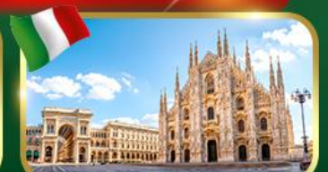
เช็คอิน มหาวิหารดูโอโน้แห่งมิลาน