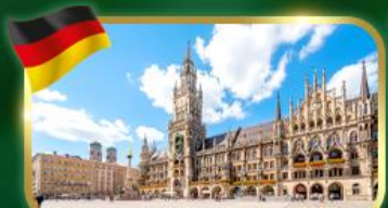
เช็คอิน จัตุรัสมาเรียนพลัทซ์