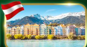
อินส์บรุค เมืองสวยเทือกเขาแอลป์