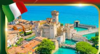
เมืองสวยริมทะเลสาบ เซอร์มิโอเน่