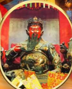
วัดกวนอู