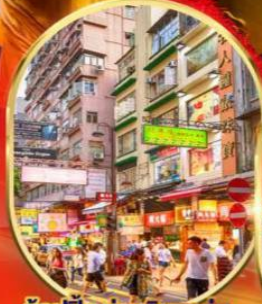
ช้อปปิ้ง ย่านจิมซาจุ่ย