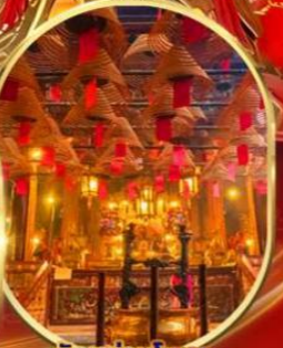
วัดหม่านโหมว