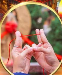
ขอพรเทพเจ้าเตี้ยแดง