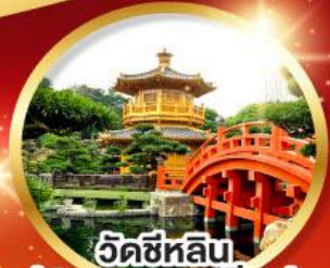
วัดซีหลิน (สวนหนานเหลียน)