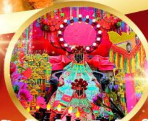
วัดเจ้าแม่กวนอิมฮ้องอ่า