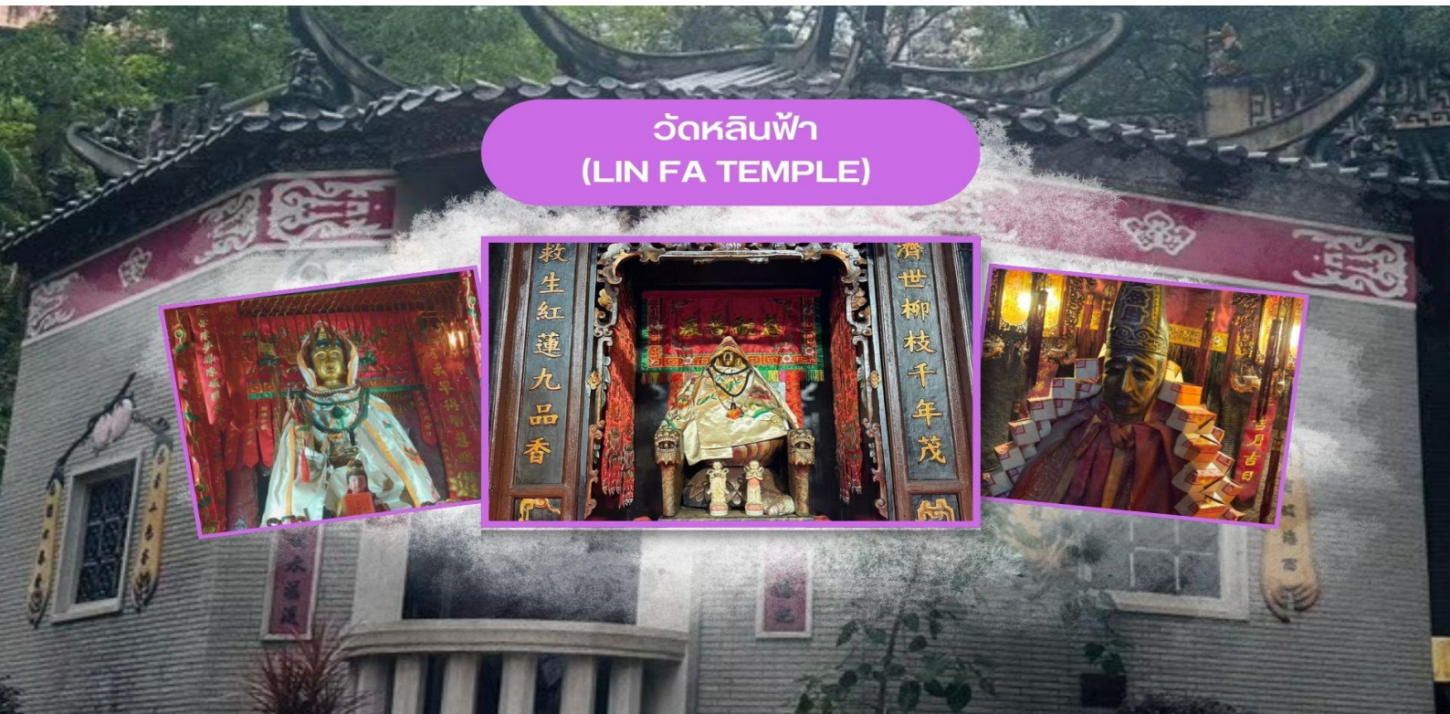
วัดหลินฟ้า (LIN FA TEMPLE)

ฮ่องกง เมืองแห่งสีสันและวัฒนธรรมที่ไม่เคยหลับใหล เป็นเมืองที่เต็มไปด้วยพลังและชีวิตชีวา ตั้งอยู่บนชายฝั่งทางตอนใต้ของจีน ที่นี่เป็นศูนย์กลางทางเศรษฐกิจ การเงิน และการท่องเที่ยวระดับโลก ผสมผสานระหว่างวัฒนธรรมตะวันออกและตะวันตกได้อย่างลงตัว