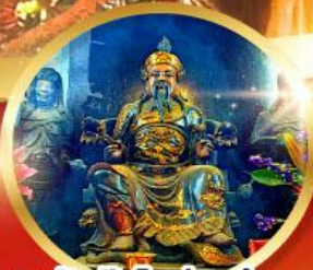
วัดปักโตฮ้องอ่า

ขอพรความสำเร็จ การงาน ขอพรความสำเร็จในชีวิตการทำงาน