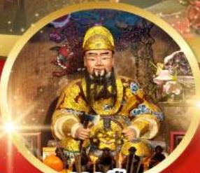
วัดแซง 600 ปี หยุทหลง

ขอพรความสำเร็จ การงาน ขอพรความสำเร็จในชีวิตการทำงาน