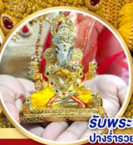
รับพระพิฆเนศปางรำรอย ท่านละ 1 องค์