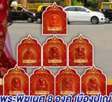
พระพิฆเนศ 8 องค์ เมืองปูณ