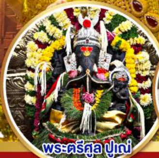
พระศรีศูล ปูณ (Trishul Pune)