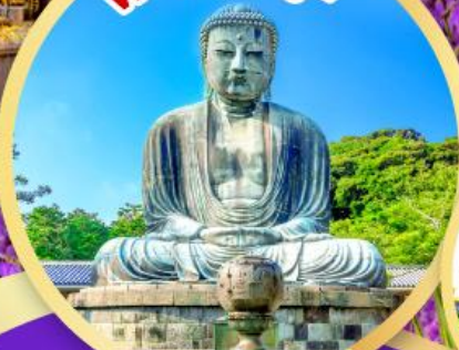
หลวงพ่อโต ไคบุคสึ