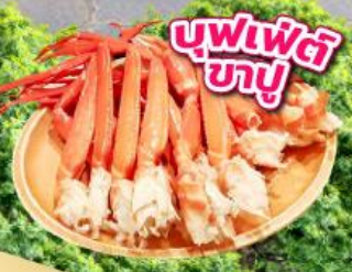
บุฟเฟ่ต์ ซาซุ