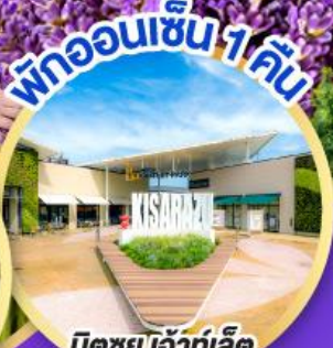
มิตซูเอะอิเกะ พาร์ค คิชะระชู