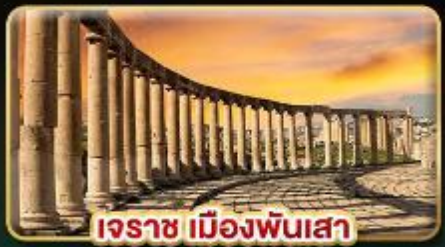
เอรราช เมืองพันเสา