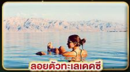
ลอยตัวทะเลเดดซี