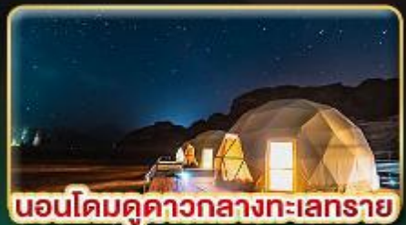
นอนโดมคูควากลางทะเลทราย

★ บินตรงสู่ "จอร์แดน" เยือน 7 มหัศจรรย์ของโลก