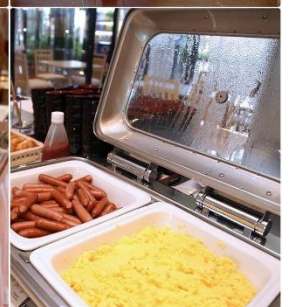
Asia Narita Hotel