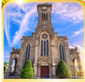
โบสถ์หินญาจาง