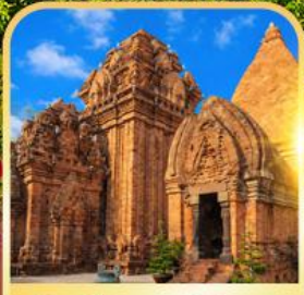
Po Nagar Cham