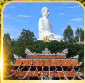
วัดลองเซิน