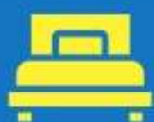
ห้องพักเดี่ยว

ตัวอย่างประเภทห้องพัก * เป็นเพียงตัวอย่างเพื่อให้เห็นภาพสำหรับประเภทห้องในแบบต่างๆ