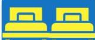
ห้องพักเตียงคู่