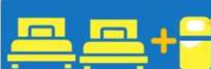
เตียง 3 ท่าน ที่นอนเสริม