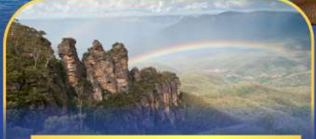
อุทยานแห่งชาติบลูเมาท์เทนส์ Three Sister Rock