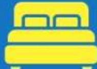
ห้องพักดับเบิล