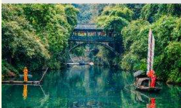
หมู่บ้านชานเสี่ยเหรินเจีย