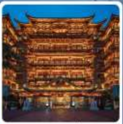
วัดตำผ้อชื่อ