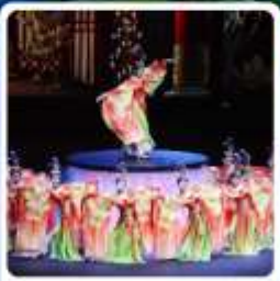
โชว์ FOSHAN QIANGQING