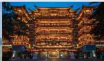
วัดต้าฝ้อซื่อ