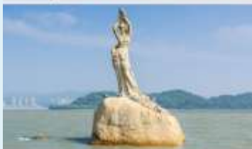
จูไห่ฟิชเชอร์เทียร์ล(หัวหิน)