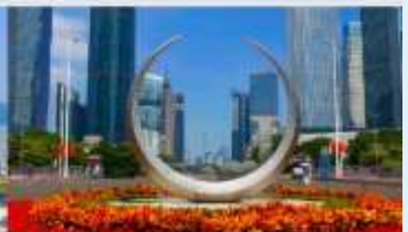
จัตุรัสฮิวเจียง

*ทางบริษัทฯ ขอสงวนสิทธิ์ในการปรับเปลี่ยนโปรแกรมทัวร์ตามความเหมาะสมขึ้นอยู่กับสถานการณ์บริษัทฯ โดยคำนึงถึงผลประโยชน์ของลูกค้าเป็นสำคัญ