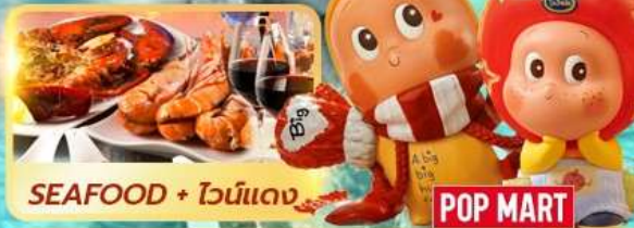
SEAFOOD + ไวน์แดง