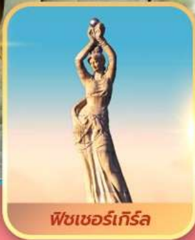
พีชเซอร์เก็รล